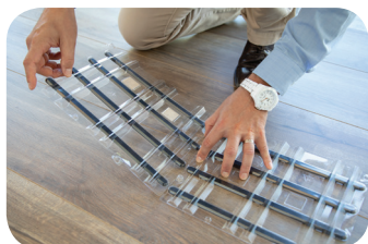
Positionner les plaques et les clipser entre elles.