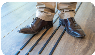
Marcher dessus pour faire sortir et coller les barrettes.